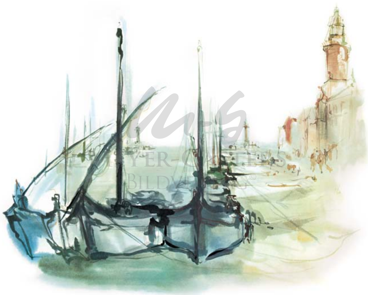
LE GRAU-DU-ROI IN SÜDFRANKREICH I