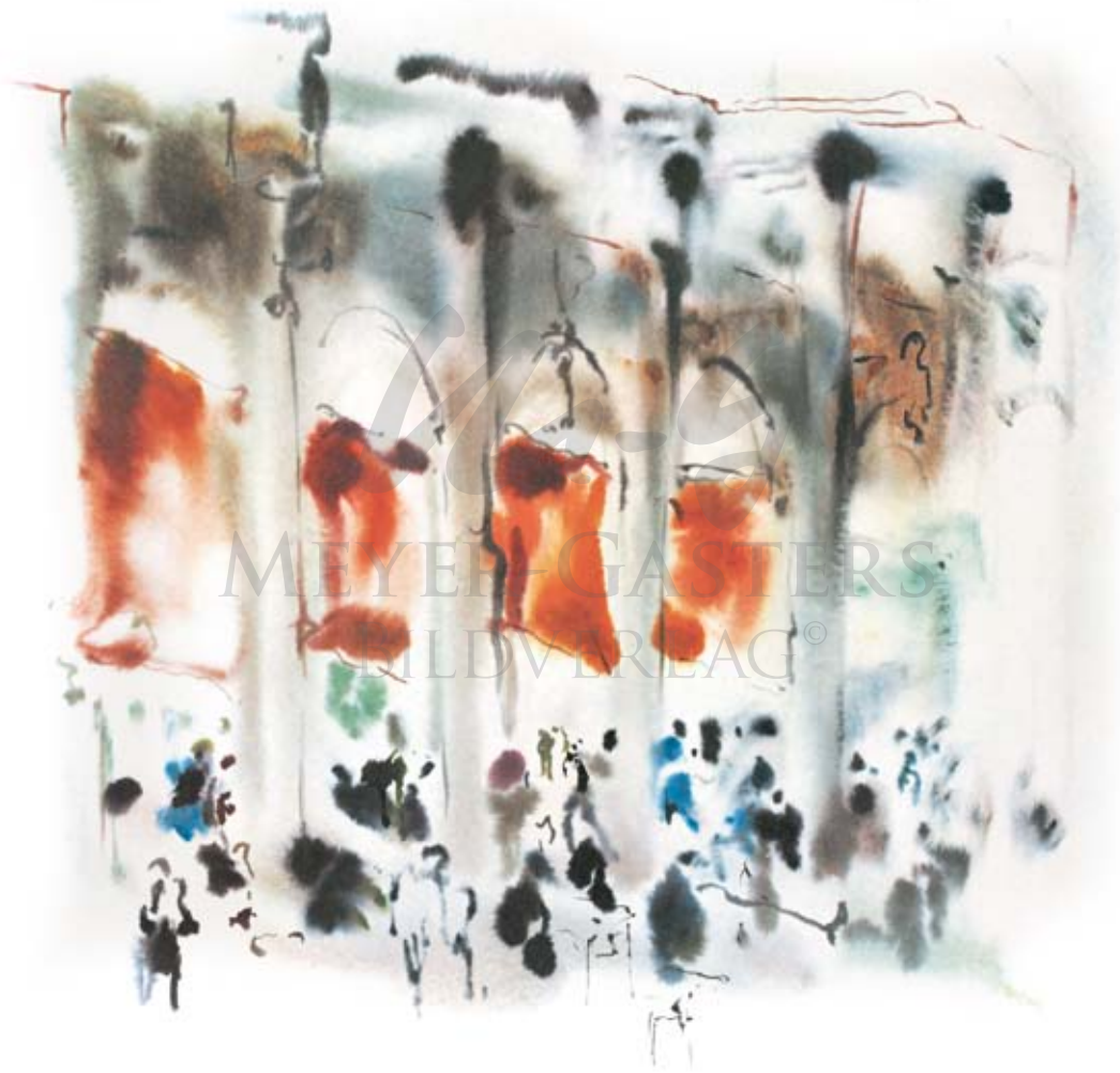
FISCHHALLE IN VENEDIG