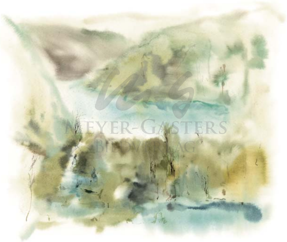
PLITWITZER SEEN IN KROATIEN I