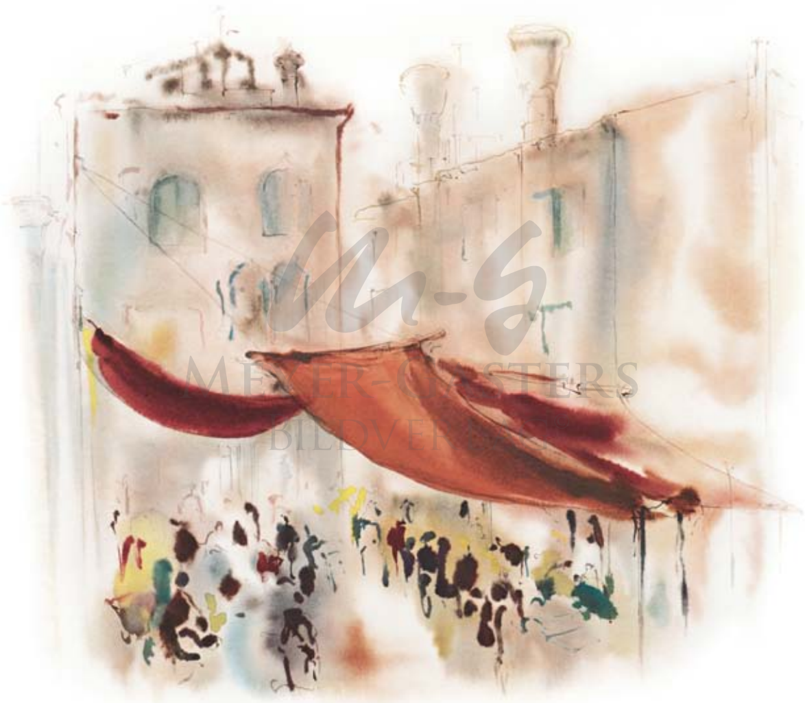
FISCHMARKT IN VENEDIG