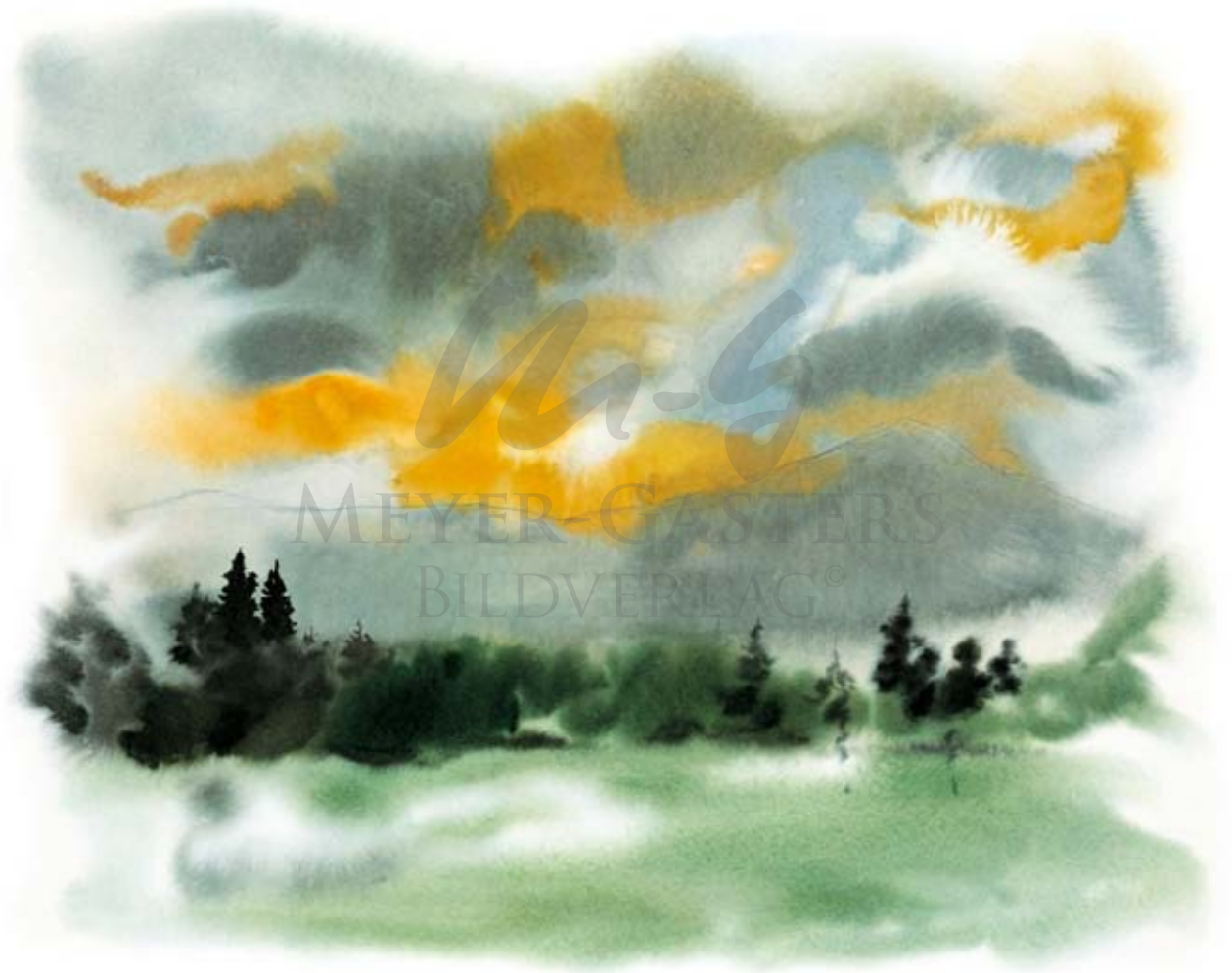
ABENDSTIMMUNG IM TAUNUS