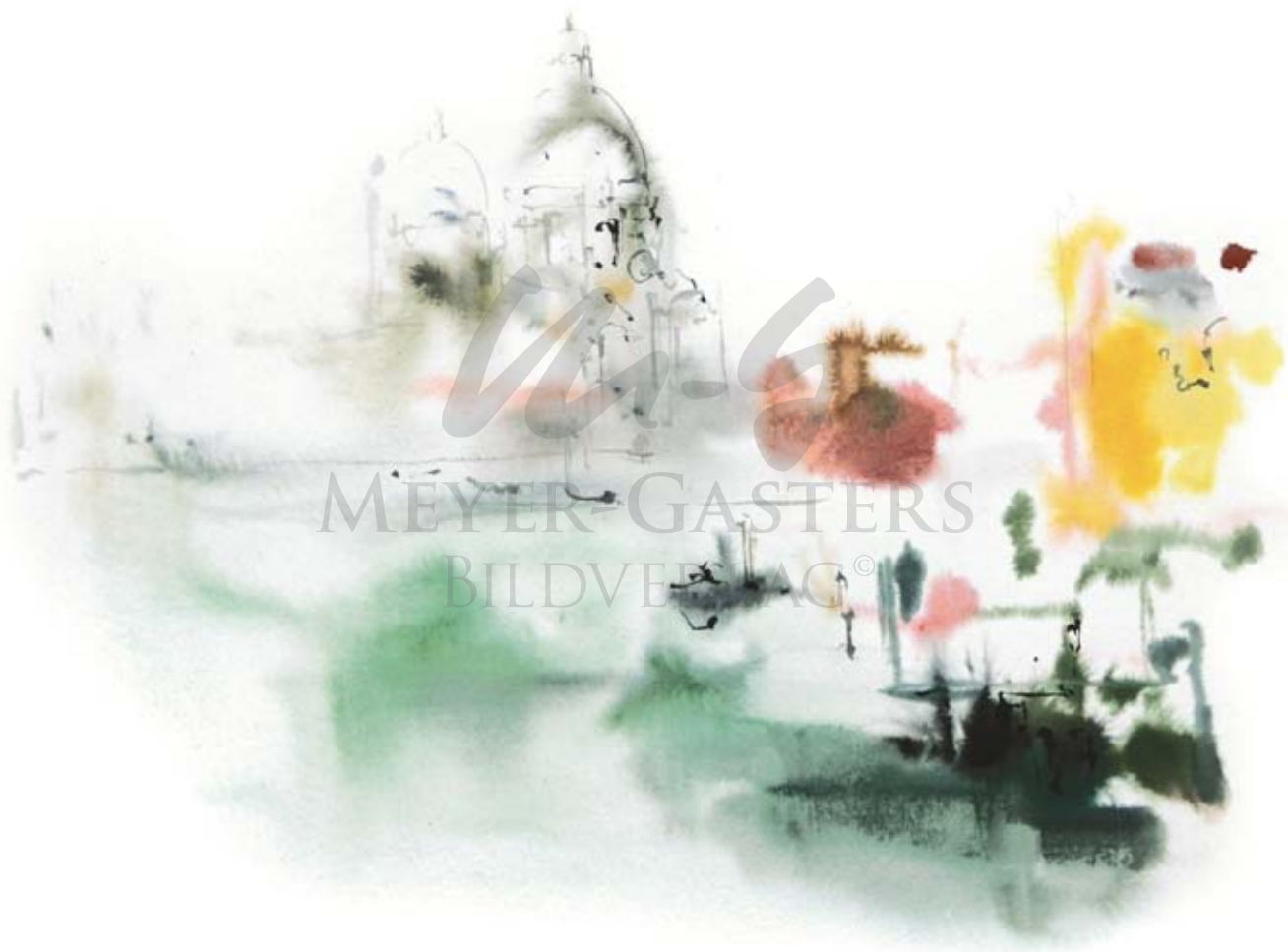
VENEDIG – KATHEDRALE SANTA MARIA DELLA SALUTE