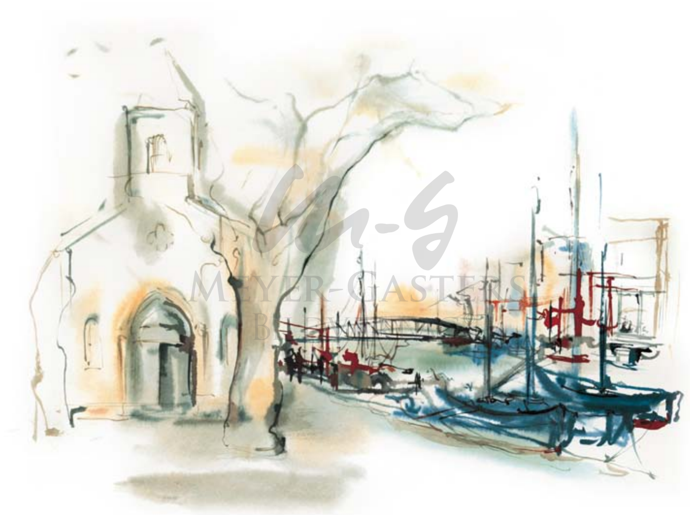
LE GRAU-DU-ROI IN SÜDFRANKREICH II