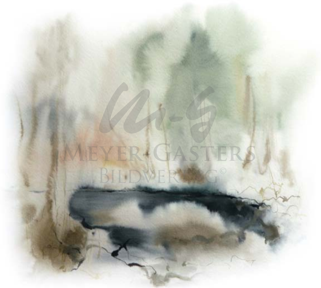
VOGELSBERGER BACH IM WINTER I